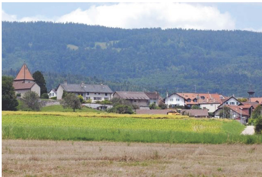
Le village espère retrouver son calme avec l'élection de trois nouveaux municipaux.

Politique Trois candidats se sont inscrits sur une liste commune. Ils remplaceront les trois élus qui ont claqué la porte avec fracas.